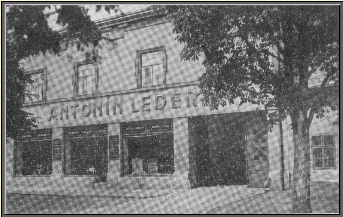
Firma Antonín Leder