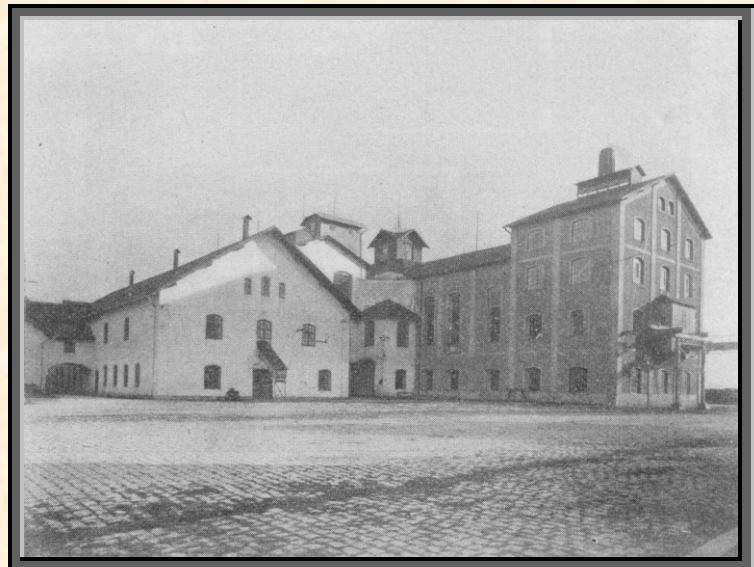
Nádvoří v Rolnickém akciovém cukrovaru