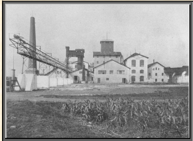
Celkový pohled na Rolnický akciový cukrovar

Postupnými rekonstrukcemi zvýšeno denní zpracování až na 12.000 q řepy a cukrovar se stal velkozávodem, na který můžeme být hrdí. Při nestranném posuzování poměrů, jež dovolily tento rozmach, nesmíme zapřít, že velkou roli hrály zde poměry válečné a poválečné, ale byla to i silná ruka vedoucích činitelů, kteří našim akcionářům budovali ze starého závodu nový, který bez větších