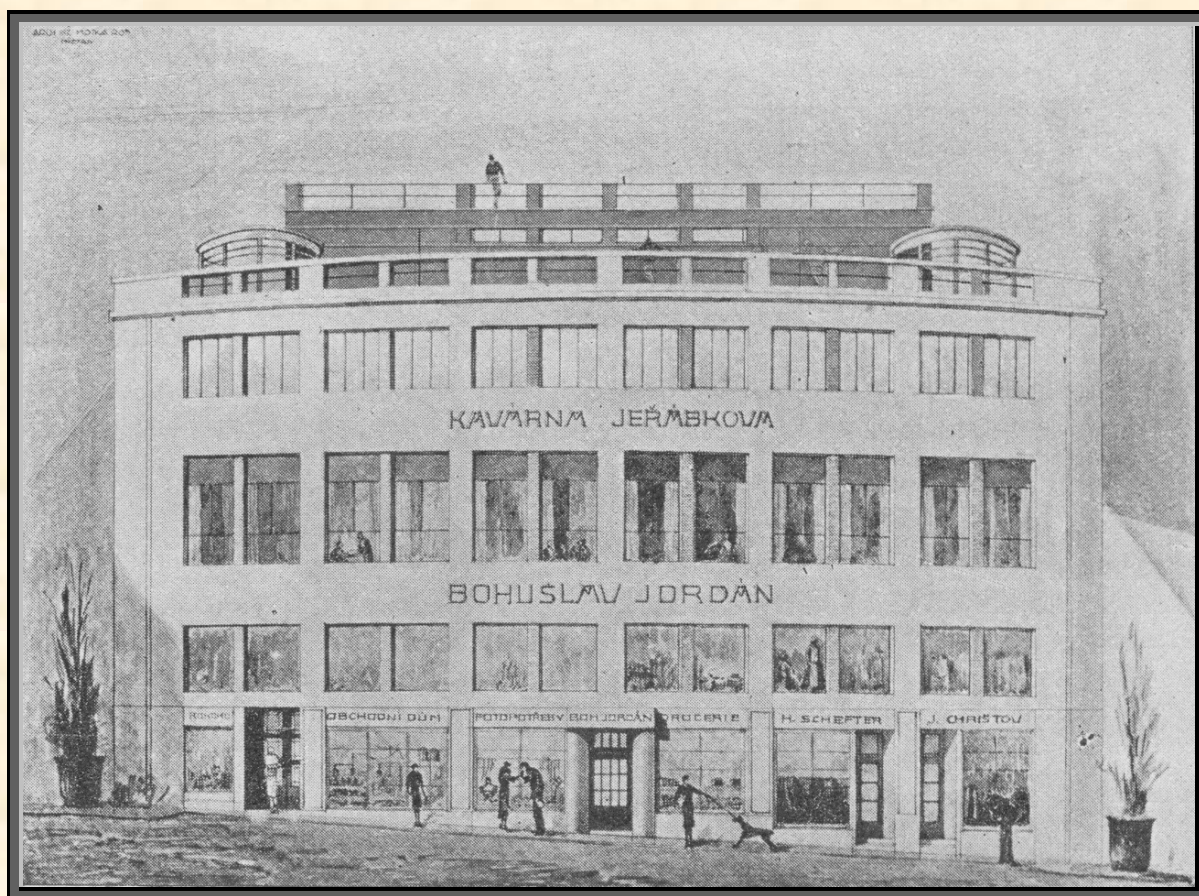
Pohled na novou budovu v Mostní ulici 1

Jordánův obchodní dům je velká, moderní, železobetonová stavba, umístěná v Mostní ulici, která svou frekvencí slíbje státi se hlavním obchodním střediskem města. Velká část prostor je určena pro obchodní podniky majitele domu, které zabírají tři etáže budovy: přízemí, suterén a mezipatro. Budova byla dohotovena v roce 1932, stavbu provedl přerovský stavitel K. Kovářik.