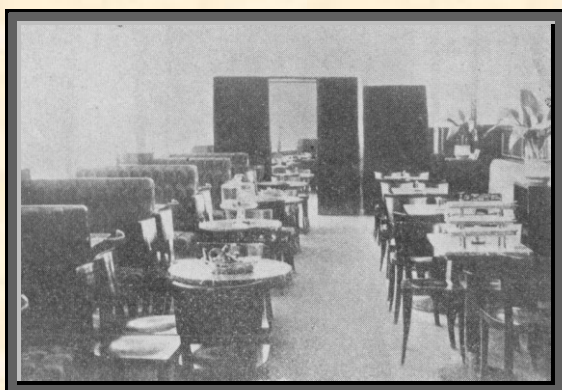
Interiér Jeřábkovy kávařny, Zařizování kávařny dle návrhů arch. Motky provedla firma Zapadlo, tov. nábytku, Přerov

Jordánův obchodní dům je velká, moderní, železobetonová stavba, umístěná v Mostní ulici, která svou frekvencí slíbje státi se hlavním obchodním střediskem města. Velká část prostor je určena pro obchodní podniky majitele domu, které zabírají tři etáže budovy: přízemí, suterén a mezipatro. Budova byla dohotovena v roce 1932, stavbu provedl přerovský stavitel K. Kovářik.