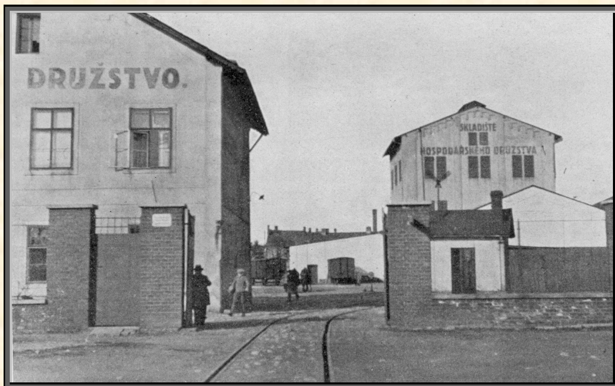
Budova a skladiště hospodářského družstva