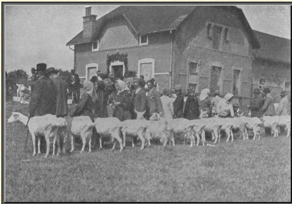
Výstavní trh sánských bezrohých koz na tržnici zeměděl. rady na Tratidlech

Svaz obesílá i jiné výstavy a zúčastňuje se pořádání výstav ovocných, zeleniny, aby propagoval zpeněžování a zužitkování ovoce, zeleniny, medu atd.