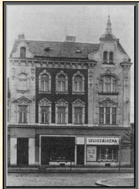
Umístění Legiozáložny na Komenského třídě

úsporných vkladů 3,134.000 Kč (po 10% poklesu v kritickém roce 1932), půjček 3,005.000 Kč, a fondů 70.000 Kč.