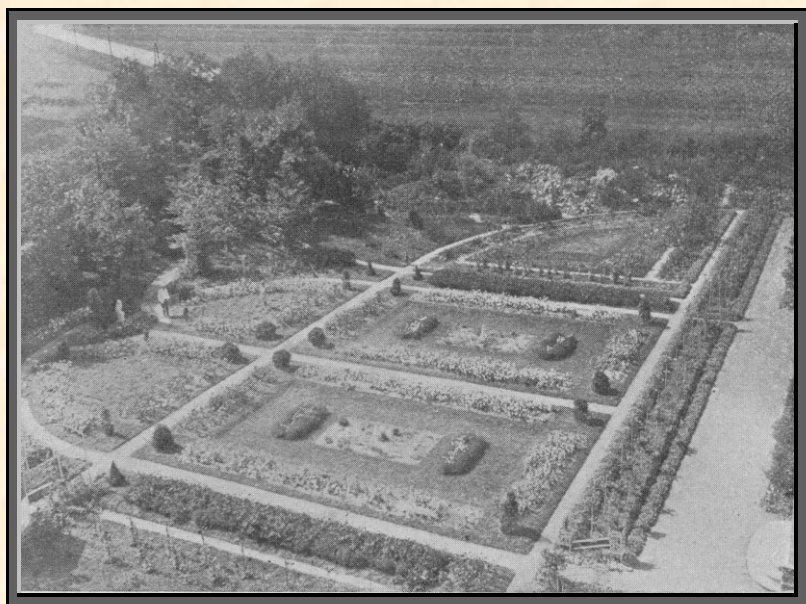
Zahrada v zem. odborné hospodářské škole v Přerově

Škola slouží k výchově praktických zemědělců; k tomu účelu má bohaté učebné pomůcky, obsáhlé knihovny, rádio, kino a pod. Velmi vkusně upravena jest školní