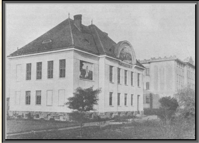
Budova zemské odborné hospodářské školy v Přerově

1913 založena prozatím jako zimní hospodářský kurs při tehdejší střední, dnes vyšší hospodářské škole, jehož správu vedl + prof. V. Stöhr.