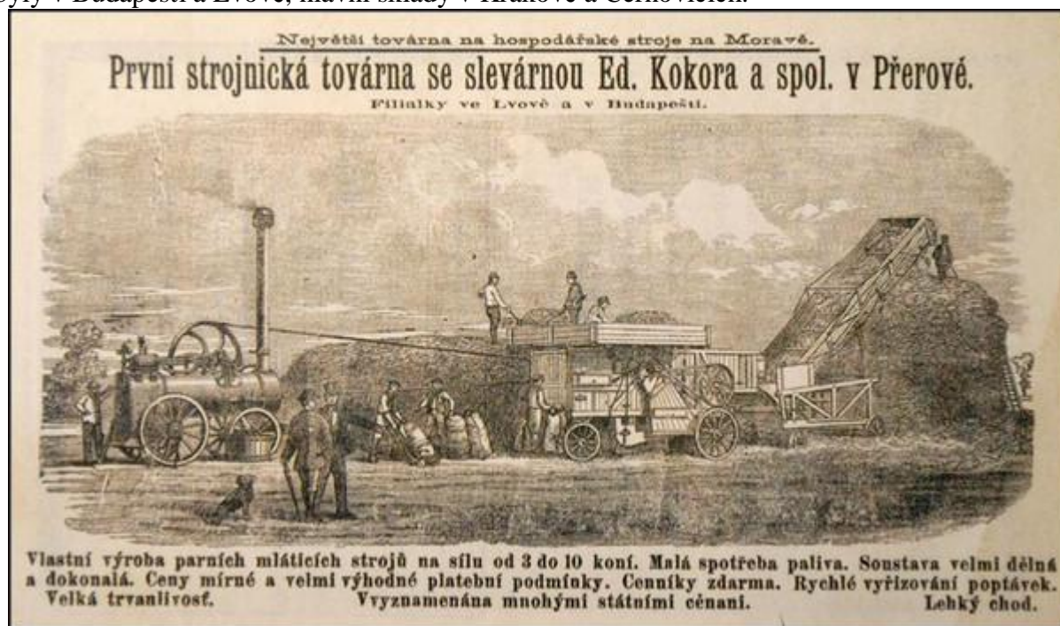
Inzerce firmy v Hospodáři moravském (SOKA Přerov)

1893 - V roce 1893 pracovalo v závodě 366 dělníků. Vyrobito se zboží za 450.000 zl.. Roční spotřeba surovin činila 1.500 m 3 dřeva a 1.500.000 kg železa. Firma vyvážela zboží téměř do všech zemí mocnářství. Filiálky byly v Budapešti a Lvově, hlavní sklady v Krakově a Černovicích.