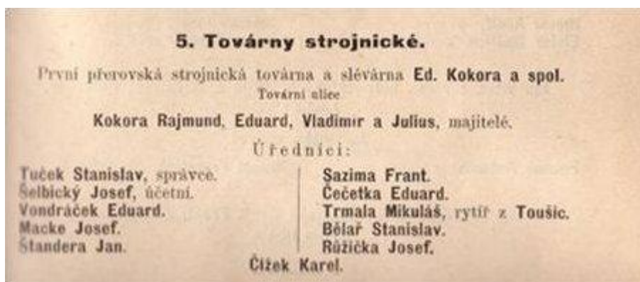
Výřez ze str. 35 Adressáře města Přerova, 1900 (SOKA Přerov)