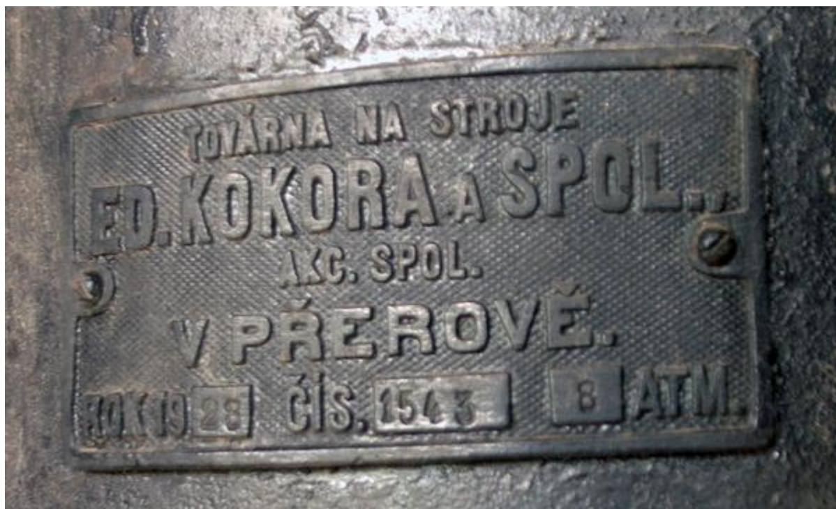
Výrobní štítek lokomobily firmy Kokora z roku 1928