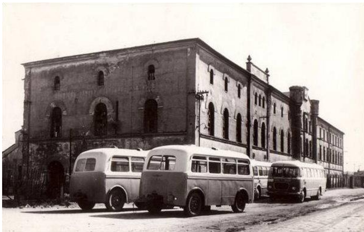
Objekty strojírny Kokora před zbouráním, 1968