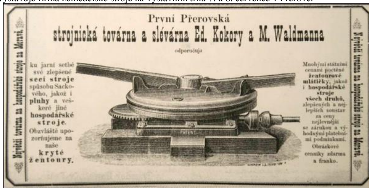
Inzerce firmy v Hospodáři moravském (SOKA Přerov)