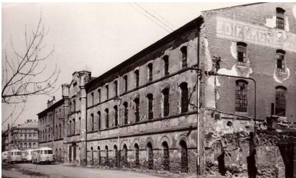
Objekty strojírnny Kokora před zbouráním, 1968