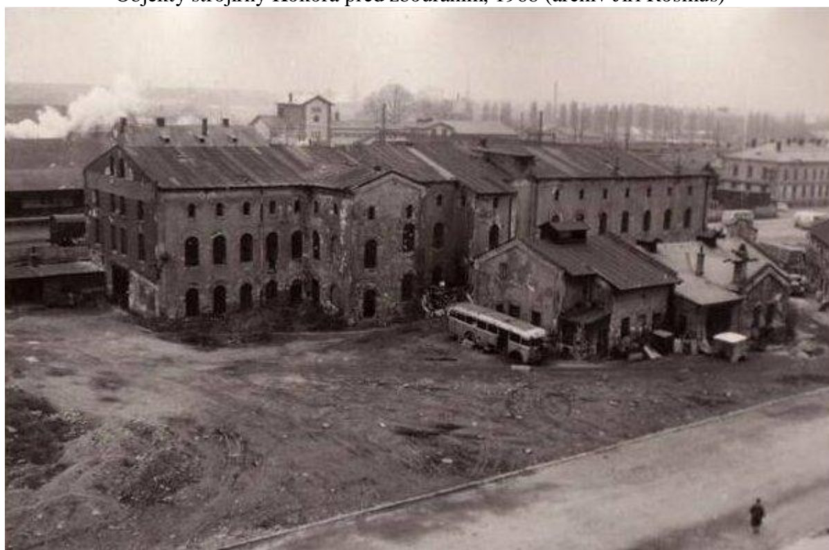
Objekty strojírnny Kokora před zbouráním, 1968

Historie jmenované firmy není věcí jednoduchou, prolínají se zde a navazují na sebe osudy několika podniků. Pokusil jsem se je uvést všechny.