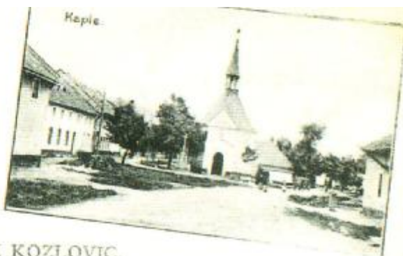
POZDRAV Z KOZLOVIC.