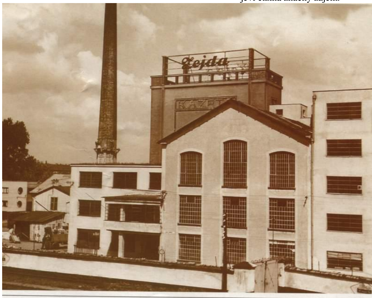
Kazeto - třicátá léta

Dnes (1932 ) zaměstnává továrna 150 zaměstnanců, jest největší továrnou toho druhu v ČSR, vyrábí denně až 1500 kufrů a 500 kg vulkanfibru vedle veškerých ostatních polotovarů, kterých k výrobě jmenovaného množství kufrů jest zapotřebí. Továrna jest zařízena tak, že je schopna krýti sama celou tuzemskou spotřebu a jest na programu, po urovnání hospodářských poměrů světových věnovati se také expertu, jelikož o výrobky firmy K. Zejda jeví cizina značný zájem.