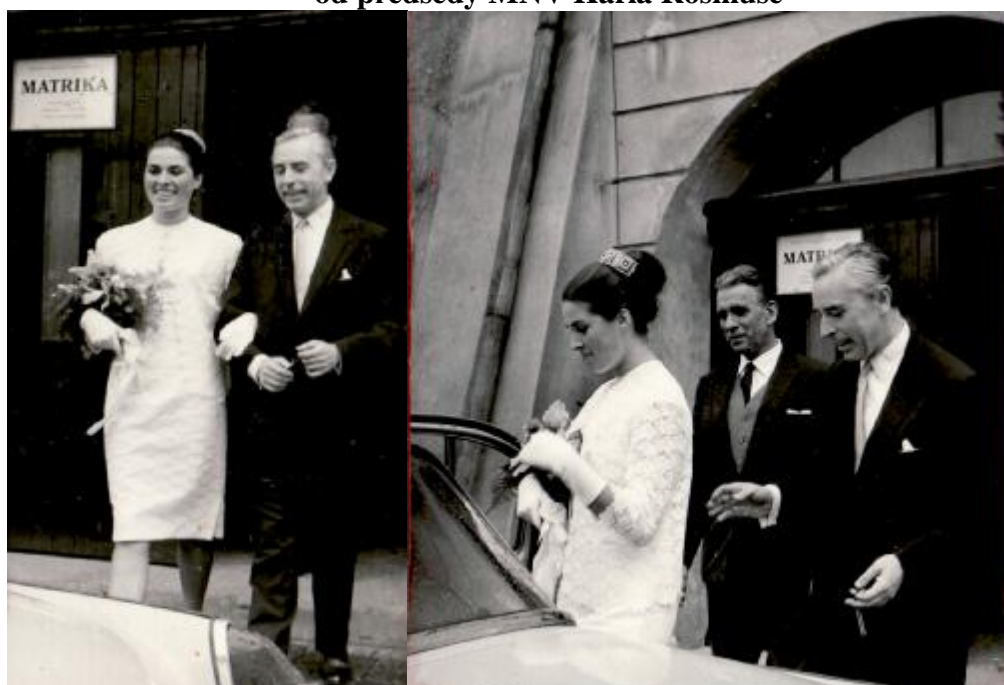
před radnicí a odjezd na svatební hostinu