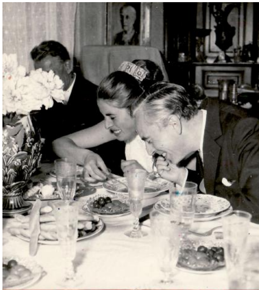
společná polévka z jednoho talíře