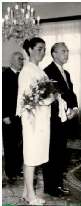
vstup do obřadní síně