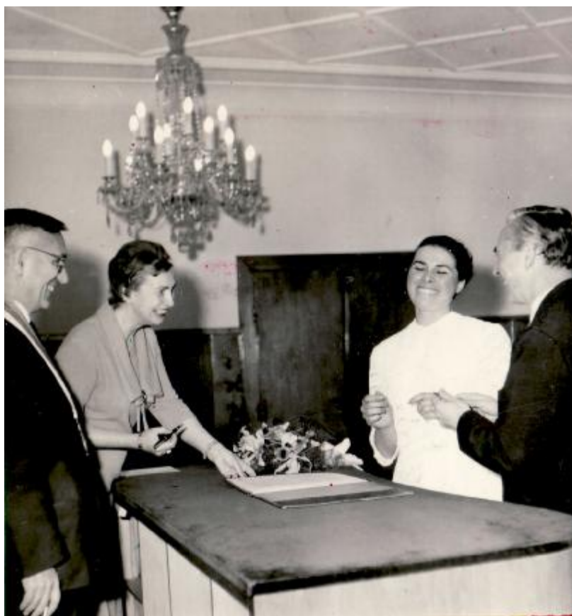
tak a jsou na řadě prstýnky