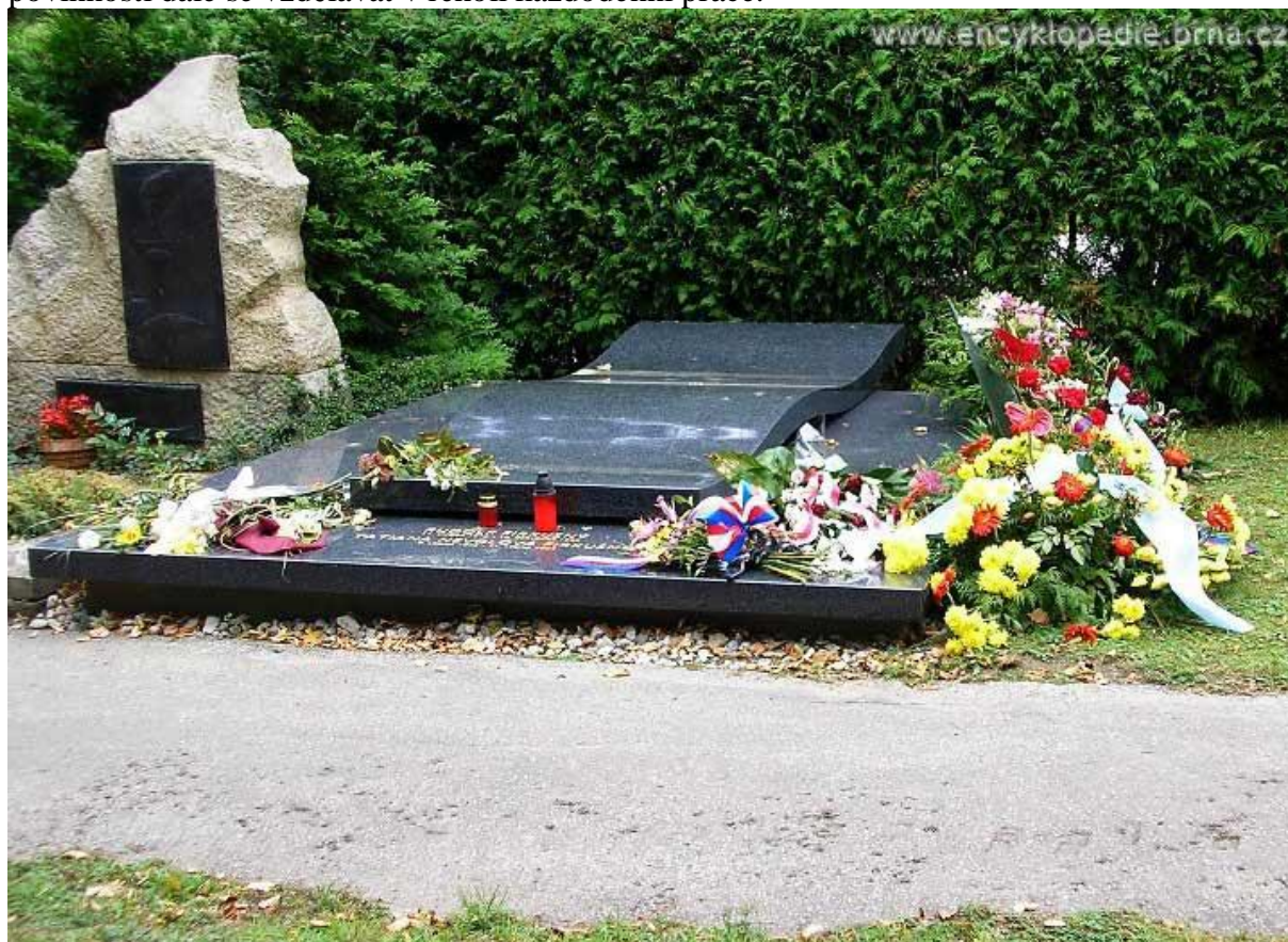
hrob Rudolfa Firkušného

Patřím věkem ke staré škole a proto mi dovoluťe ocitovat z Catonových jednověří, že doctrina est fructus dulcis radicis amarae, že vzdělání je sladký plod hořkého kořene. Ona hořkost či trpkost platí pro objem vykonané práce, jež není nikdy snadná a bez obětí času, sebekázně, píle, soustředění. Avšak bez pracovního vypětí není cesta ke vzdělanosti možná. Konečně, bez vzdělanosti nelze si dnes představit ani jakoukoliv tvůrčí činnost, včetně tvorby umělecké. Potvrzuje mi to veškerá má životní a umělecká zkušenost. Přináší ovšem i radost a uspokojení z díla, pocit, že tvůrčí úsilí nebylo a není marné, ba něco navíc: udržuje mysl mladou a svěží. Tož, v tomto směru se odvažuji přijmout vaši velkolepou poctu, věda dobře, že mne nezbaví povinnosti dále se vzdělávat v řeholi každodenní práce.