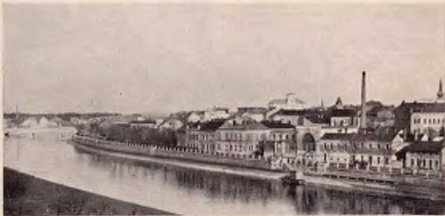
Přerov. - Pohled od Bečvy.