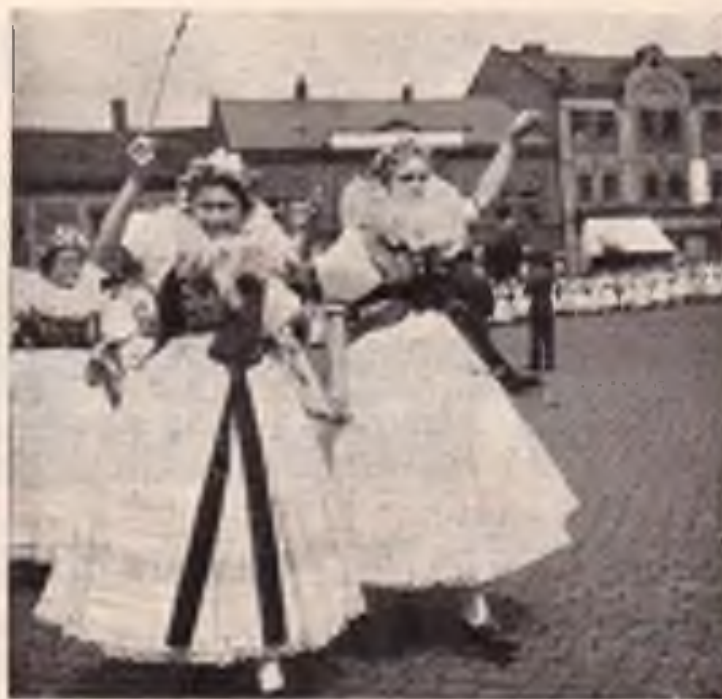
Hanačky vás zvou na Hanou a na Hanácký jar-mak v Přerově.

všecke, ale bódó hanáčky a tem e pěkněši. A s počasim? Jož to taky nějuk oděláme.