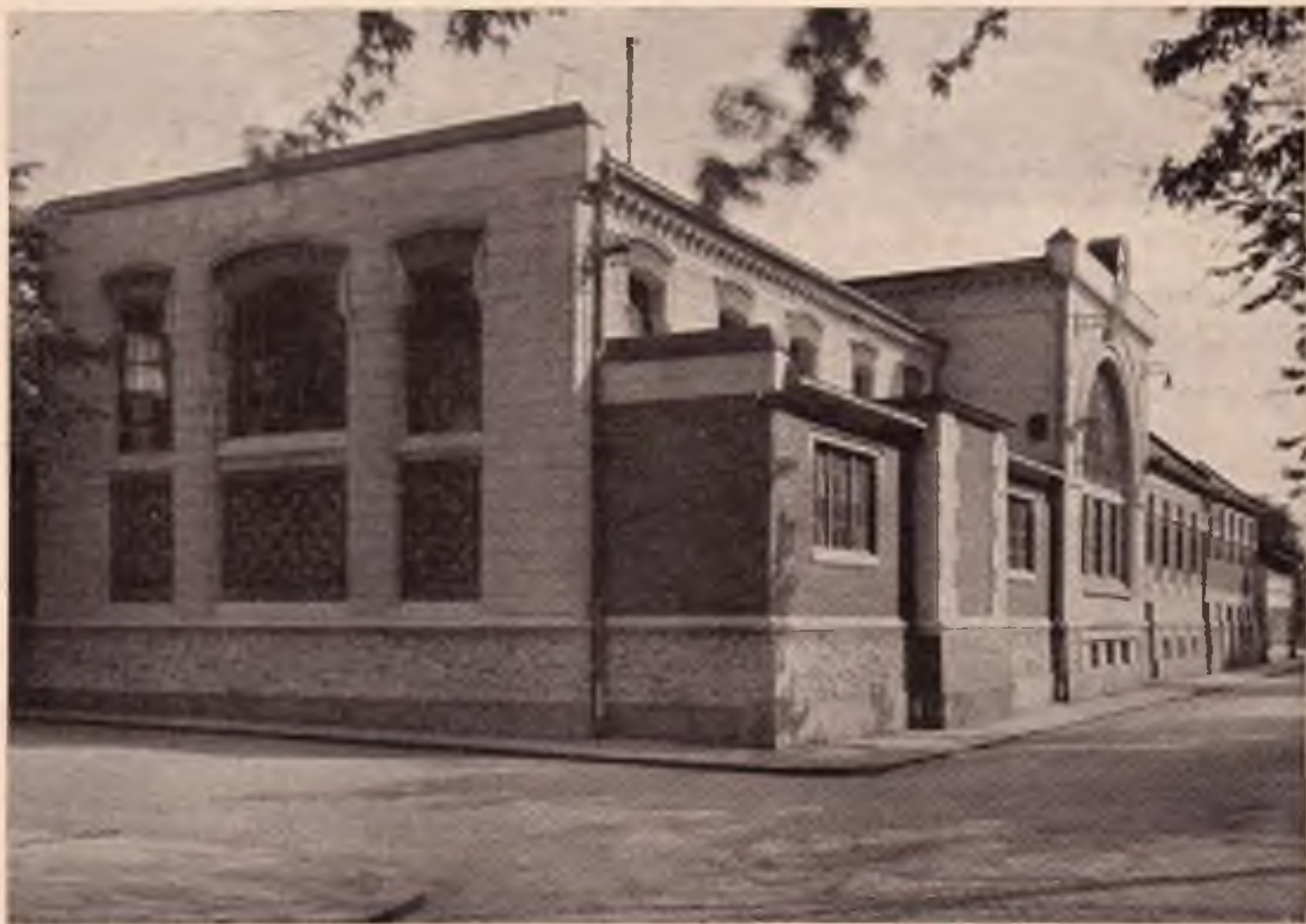
Budova Městských elektrických podniků v Přerově.

Prodejna na Žerotínově nám. čís. 5, telefon 129.