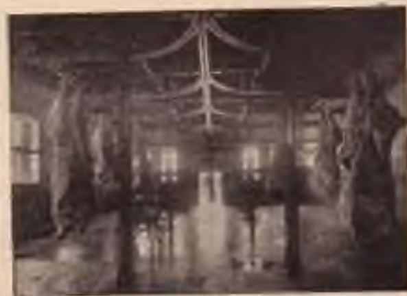
Porážka hovězího dobytka