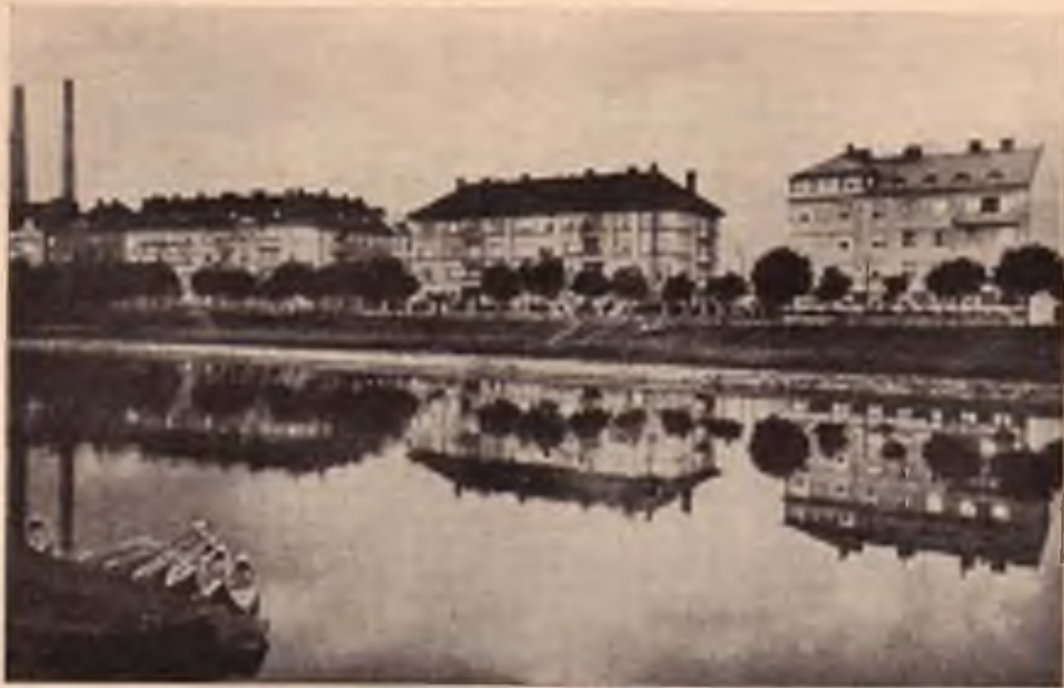
Píerov: Bečva. Pohled na nábreží.

přírodní rezervace a kde je postavena známá moravská ornithologická stanice. Ač teprve budována a její okolí vhodně přizpůsobováno, je již nyní cílem tisíců návštěvníků. Každý, kdo má zájem o ochranu ptactva a přírody, prohlédne si tam živé chovance, ale zvláště ornithologické museum, podívá se na vodní ptactvo na rybníčku a na okolí stanice.