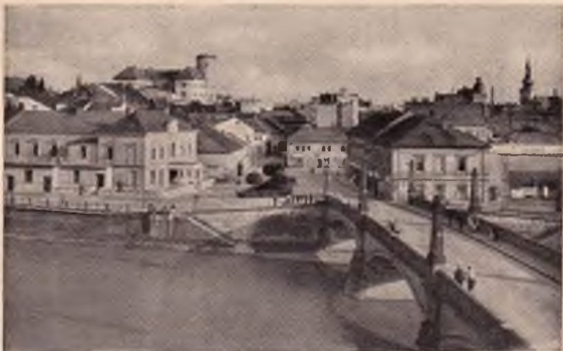
Píerov: Mostní ulice - v pozadí Zerotínův zámek.