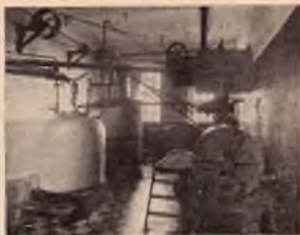
Strojní zařízení kafilerie

Omračování hovězího dobytka provádí se většinou pomocí omračovacích železných palic, u těžkých kusů používá se též stělného aparátu system Schermer. Vepří omračují se olektrickými kleštěmi.