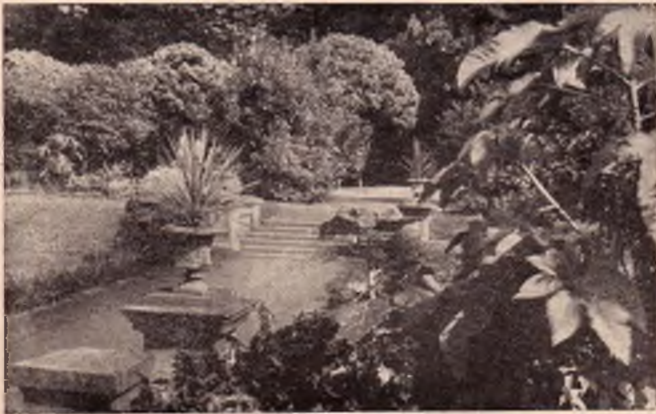
Píerov: Partie ze sadu Michalova

Od severu vzhlíží Čekyňský kopec, od severovýchodu je Michalov chráněn lesem Žebračkou, nejbohatším to moravským místem na původní květenu. Na východní straně dotýká se Michalov přímo