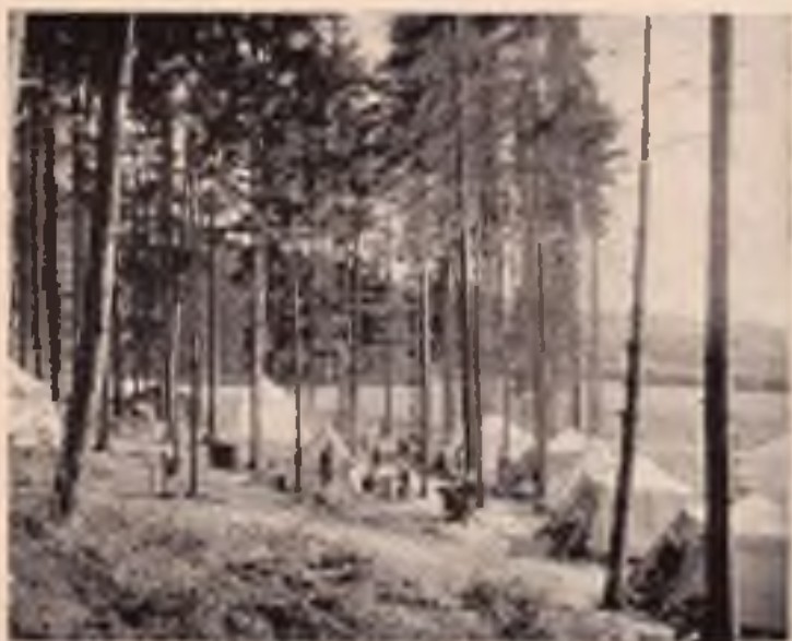
Píerovsko: Letní tábořiště v Čekyni.

Použitím dráhy na nevelkou vzdálenost dostaneme se na výletní místo — hrad Heřtýn u Lipníka a směrem východním do známého poutního místa — Hostýna. Rozsáhlé lesy Hostýnské s chatou na Tesáku jsou hojně navštěvovány a skýtají mnoho vycházek, vyhovujících různým zálibám milovníků našich krásných Hostýnských hor.