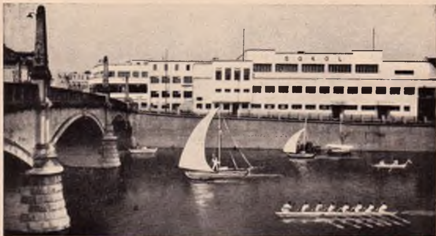
Píerov: Vodní sporty na Bečvě. V pozadí píerovská sokolovna.