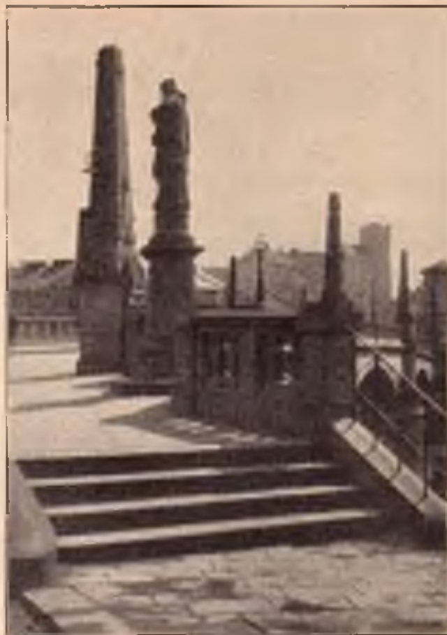
Ze starého Přerova.

Ostatní Přerov dýchá životem pilného průmyslového města; velké elektrárny, ložárny na hospodářské stroje, na optické