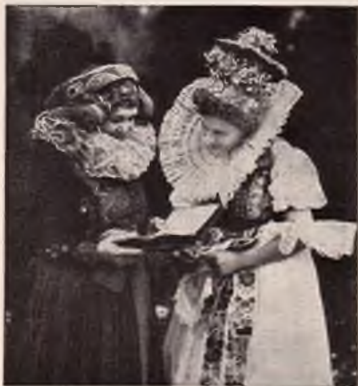
Hanačky cestou do hostela.

Na ten »Hanácké deň« sme si extra vehrnole rokáve. Přejede vic kroju, hlav-ně našech hanáckých. Zveke bódó zas