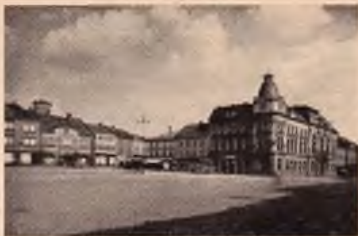
Přerov: Masarykovo nám.

V Přerově jsou zastoupeny čtyři druhy peněžních ústav: spořitelna, záložny, banky a peněžní společnost s r. o. Je tu nejstarší záložna na Moravě (Úvěrní spolek záložna přerovská), zal. r. 1861. V letech 1885—1892 byly založeny Městská spořitelna, Okresní záložna a Občanská záložna. Pak nastala dlouhá přestávka 20 let. V letech 1912 a 1913 byly založeny další dvě záložny: Raiffeisenka a Živnostenská záložna, v dalších 10 letech opět dvě záložny: Dělnická záložna, Všeob. záložna (r. 1921) a konečně r. 1929 Záložna továrny hnojiv.