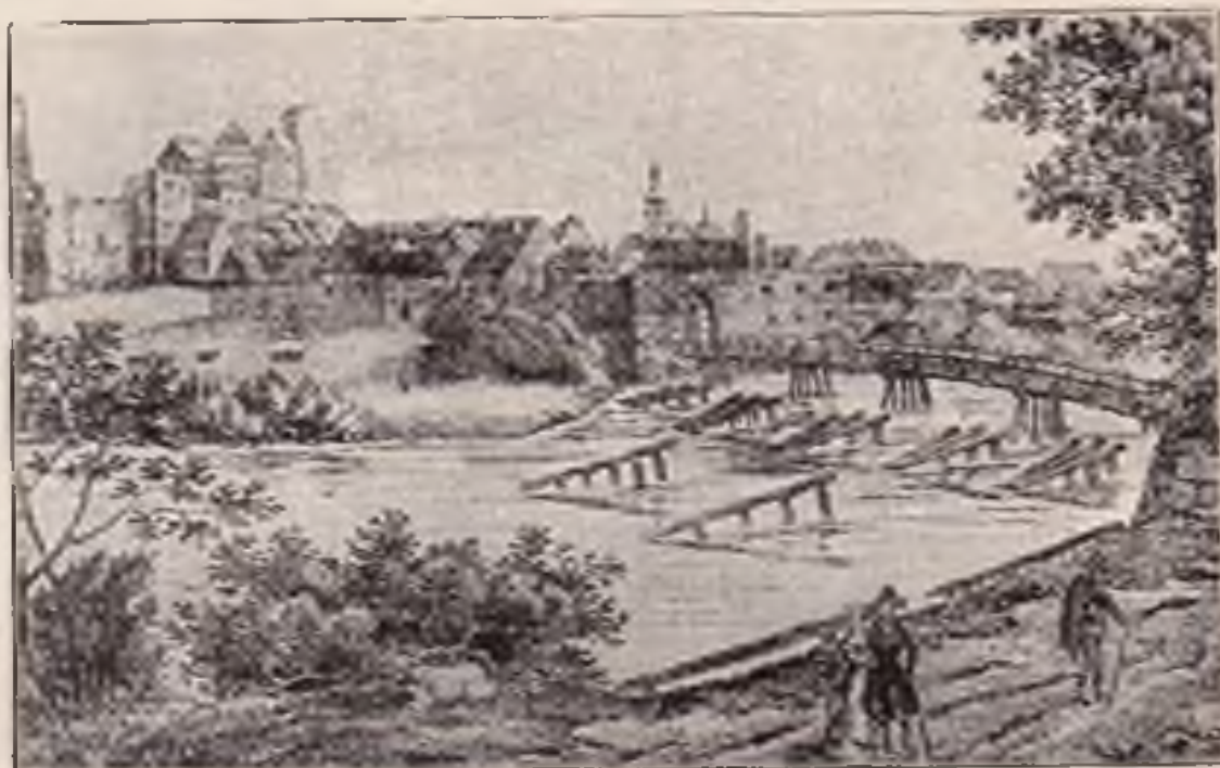
Pohled na Přerov od Brabantska z r. 1800.

Z jedinečného sídliště pravěkého člověka stalo se moderní město, které jistě i v budoucnu nedá se zastíniti svou velikou minulostí.