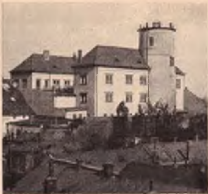
Přerov: Zerotínův zámek, majetek města.

Nezaslouženě opomíjeny jsou Chřiby, spadající do stěry odboru KČT v Kroměříži, které zvláště na jaře poskytují ve svých listnatých lesích příjemného osvětlení a zároveň občerstvení ve známé době řízené restaurací na Bunči.