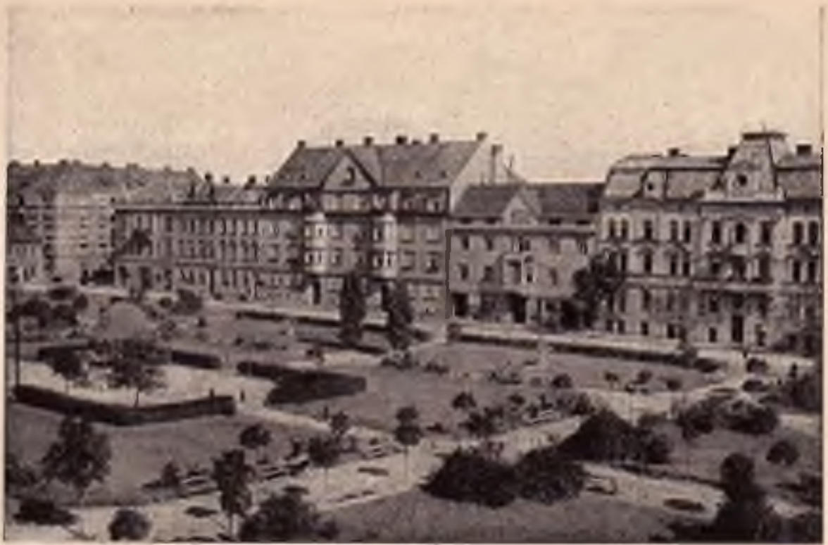
Píerov: Náměstí svobody.