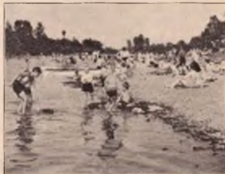
Píerov: U Bečvy.

Povodí Bečvy totiž láska všech Píerovců-vodomilů. Nezapomeňte až pojedete v létě k nám do Píerova vzít si s sebou koupací úbor, abyste s námi mohli užít toho, čeho máme v Píerově dostatek t. j. slunce, vody a čistého vzduchu.