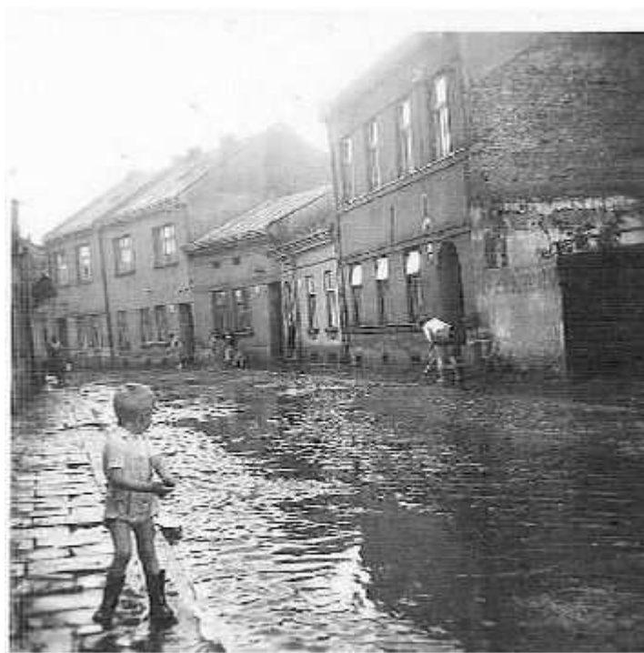
V KOZLOVSKÉ. Na boční straně domu jdou vidět stopy po budově zničené bombou v roce 1944.

Paní Zdenka Kohoutková, rozená Nezhybová, tenkrát bytem Přerov, Trávník č. 61 (prakticky sousedka paní Sýkorové – Ganguli, o které se nedávno psalo v NP), píše a vzpomíná: „V době bombardování mi bylo osm let. Jsou věci, které si zapamatujete na celý život. Bylo to před polednem, nebo po poledni, přesně nevím, kdy bylo slyšet hukot letadel. Dívala jsem se na ně, jak letí od Bečvy. Zaslechla jsem střílení, a proto jsem utekla domů. Vtom to začalo rachotit a všechno se začalo bortit. Řinčelo a rozbíjelo se sklo, nárazová vlna nám vyvrátila vrata od ulice a rozbila okna. Po uklidnění jsme zjistili, že bomba dopadla přímo přes cestu na domy Trávník č. p. 52 a 54, kde přišly o život paní Černošková s vnučkou Dášou, která