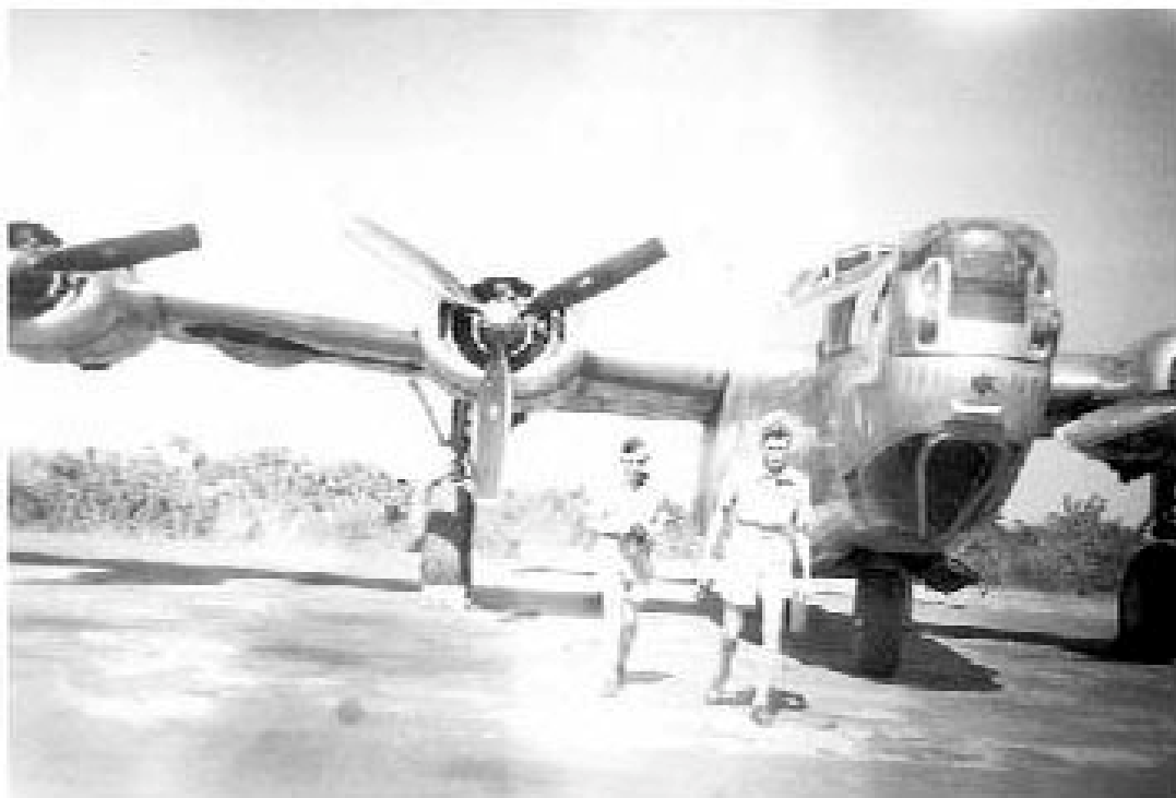
PŘINESLY ZIKÁZU. Bomby na Přerov dopadaly z těžkých amerických bombardérů zvaných Liberator.

U nás bylo jasno a na listopad nezvykle teplo, nad rafineriemi v Blechhammeru a Odertalu byla hustá mlha. To nikdo netušil.