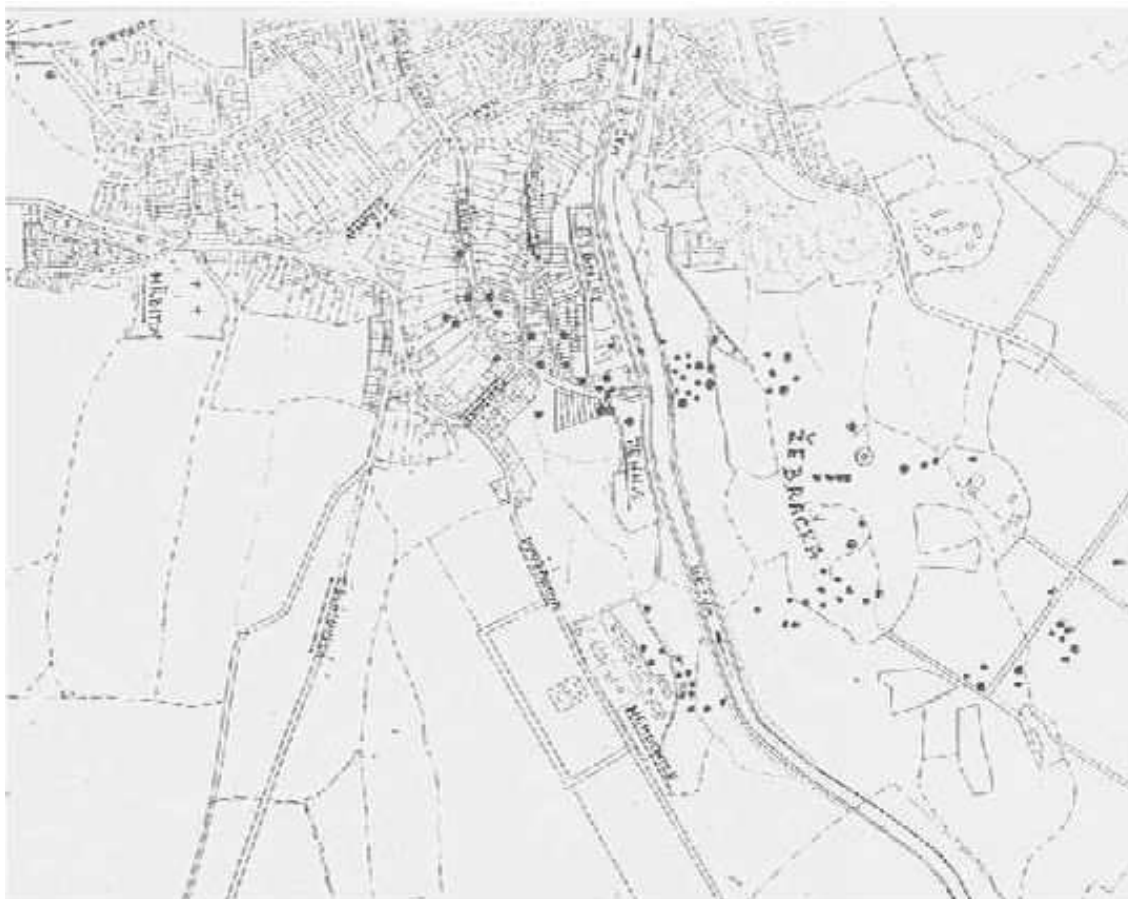
BOMBARDOVÁNÍ. Mapka Přerova s černě vyznačenými místy, kde v listopadu 1944 dopadly spojenecké bomby.