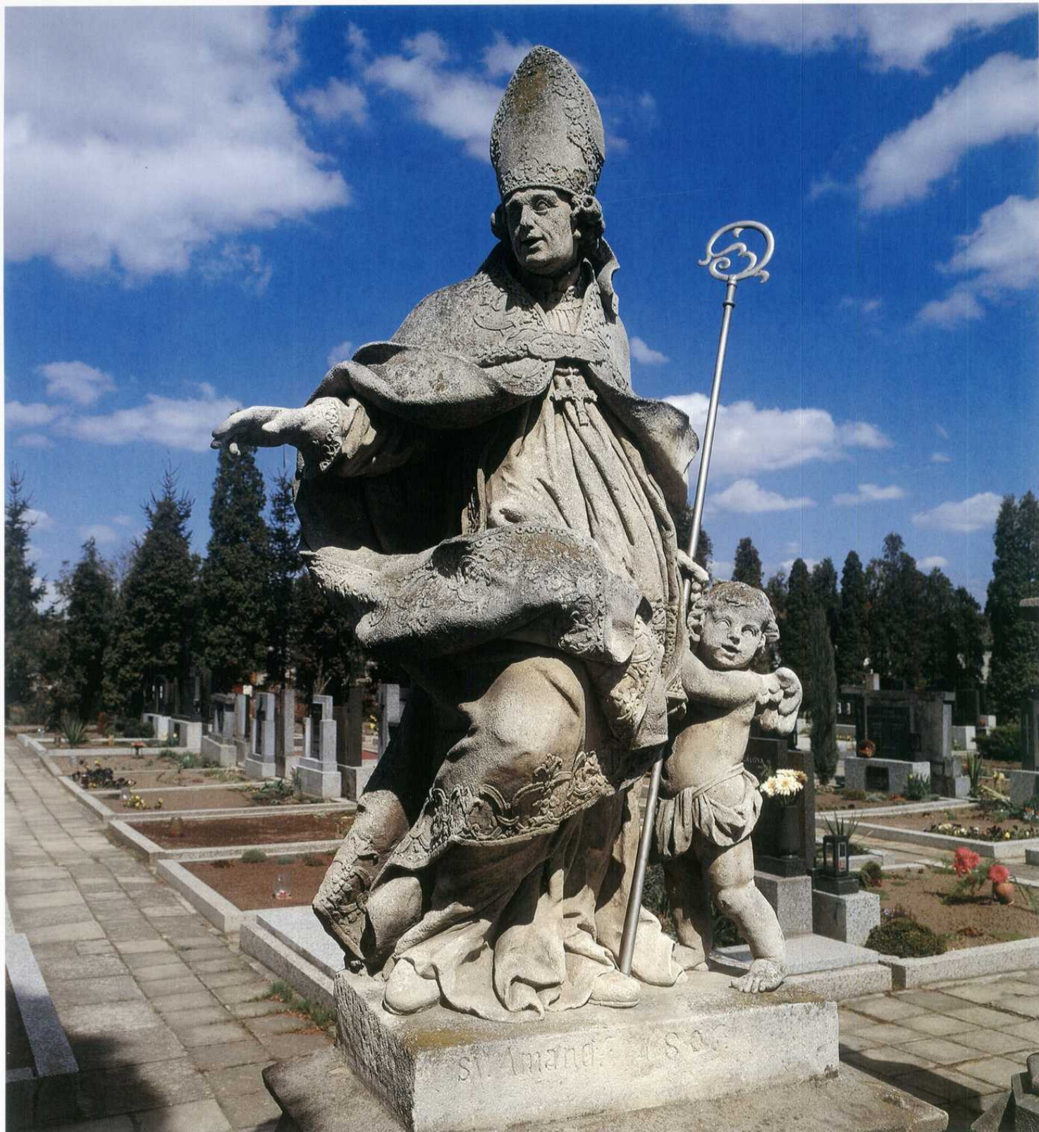
TROUBKY - barokní socha sv. Amanta od B. Fritsche z 18. století