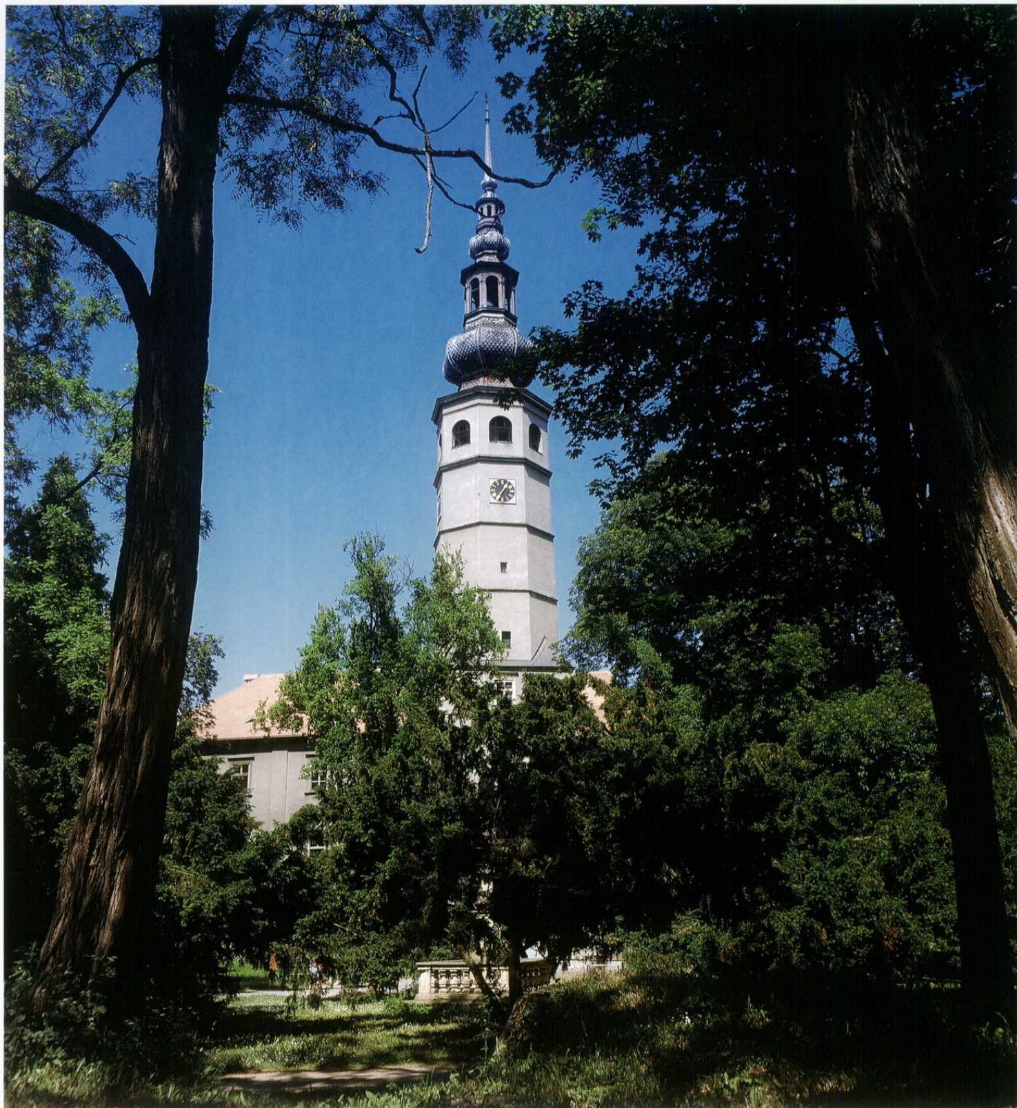
TOVAČOV - zámek s parkem a nejstarším renesančním portálem u nás z r. 1492