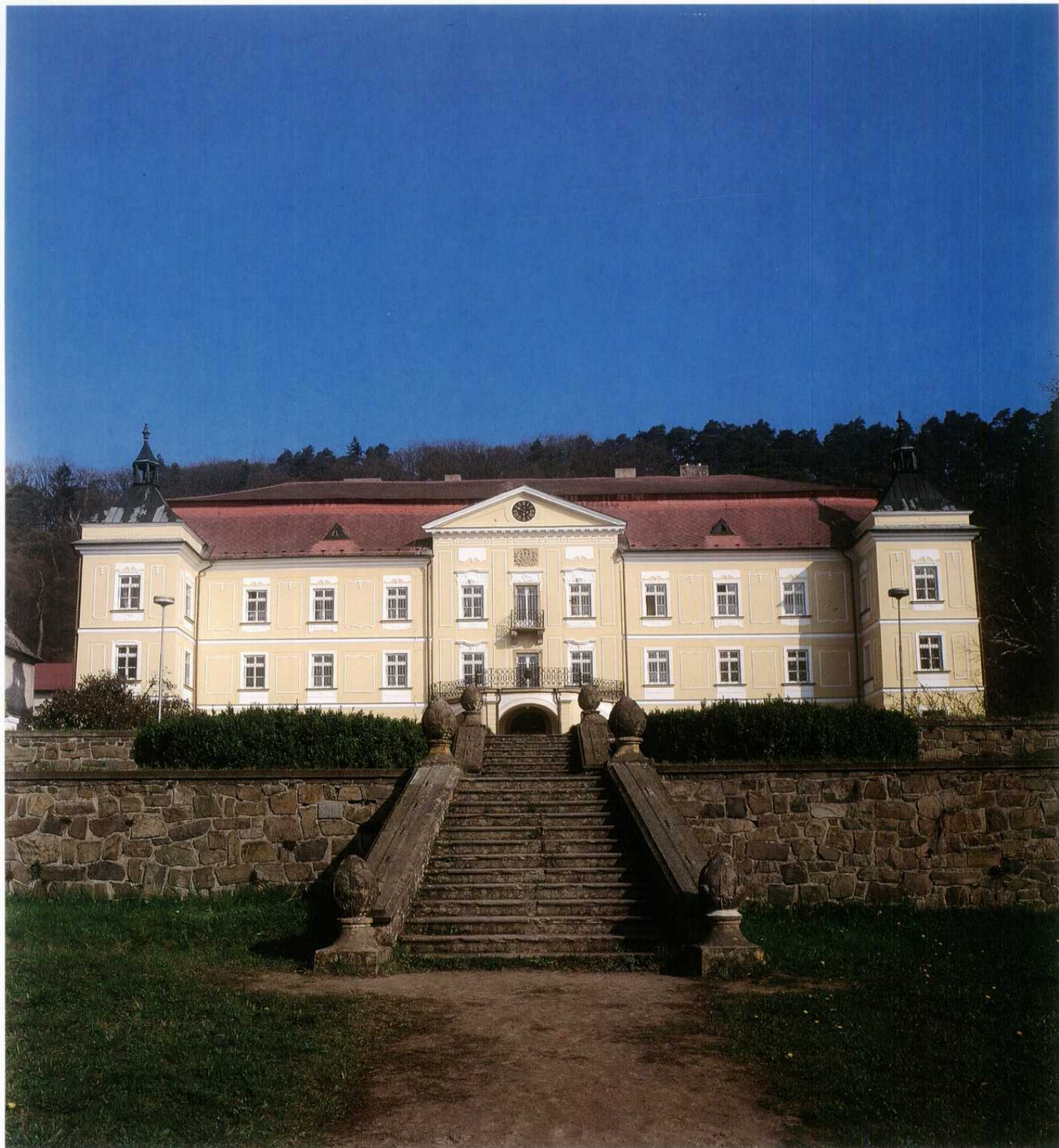
VESELÍČKO - zámek s anglicko-francouzským parkem