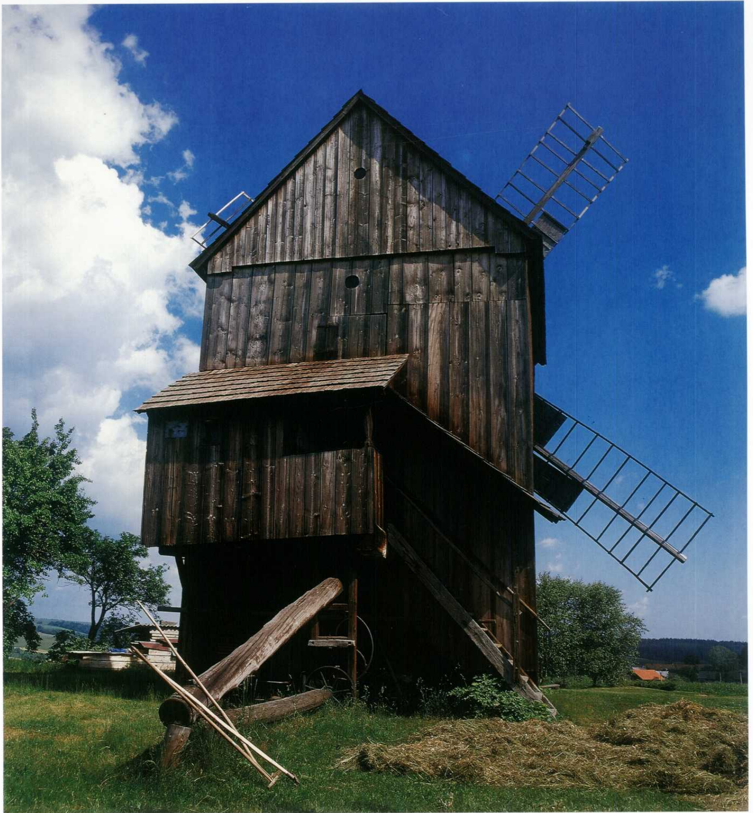
PARTUTOVICE - větrný mlýn beraního typu