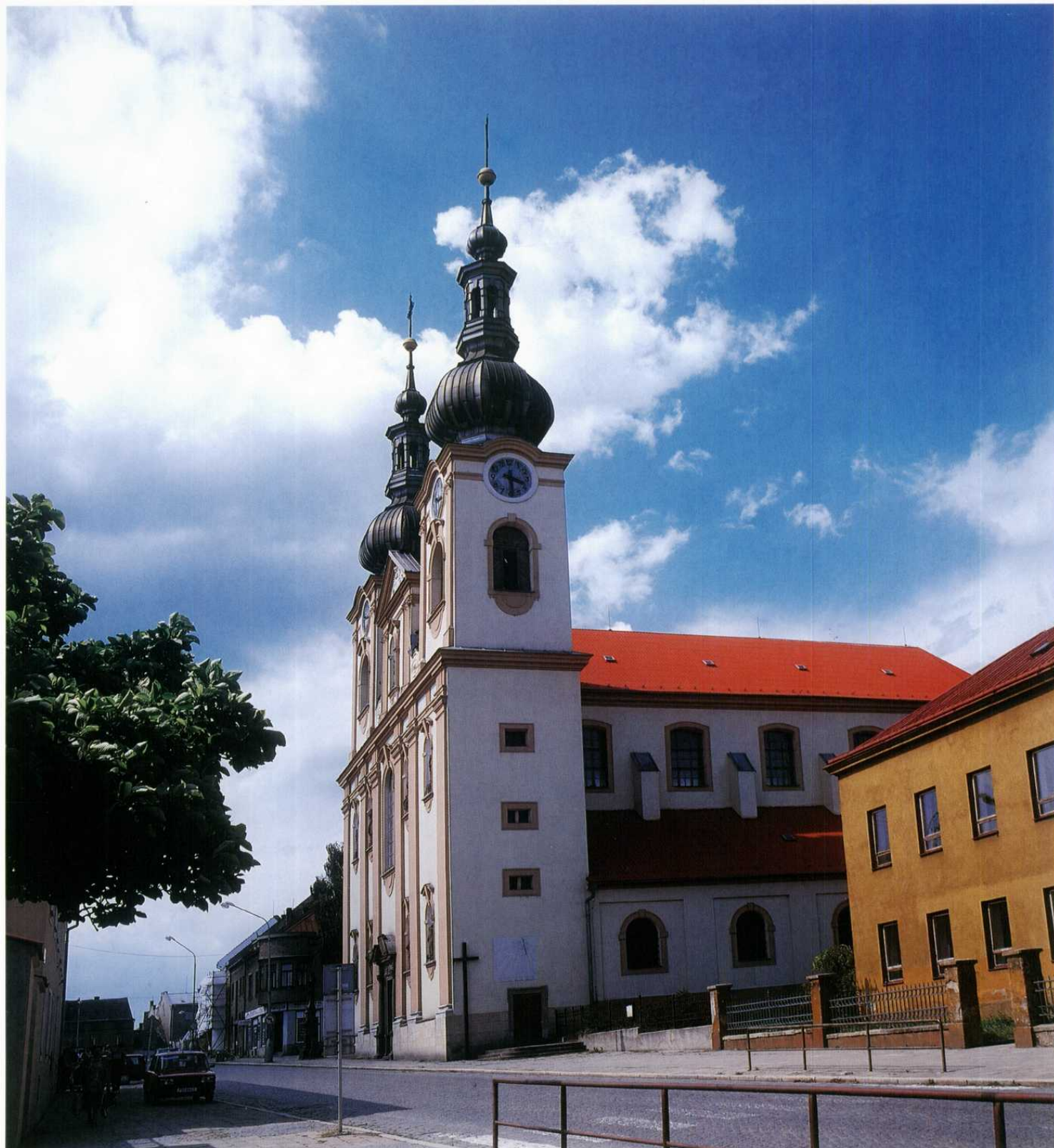
KOJETÍN - farní kostel Nanebevzetí Panny Marie