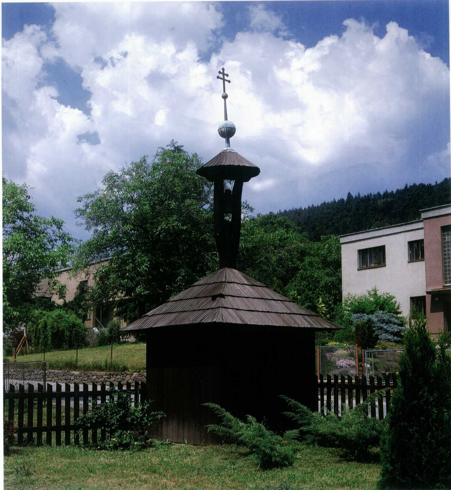
HRABŮVKA - zvonička, ukázka lidové architektury