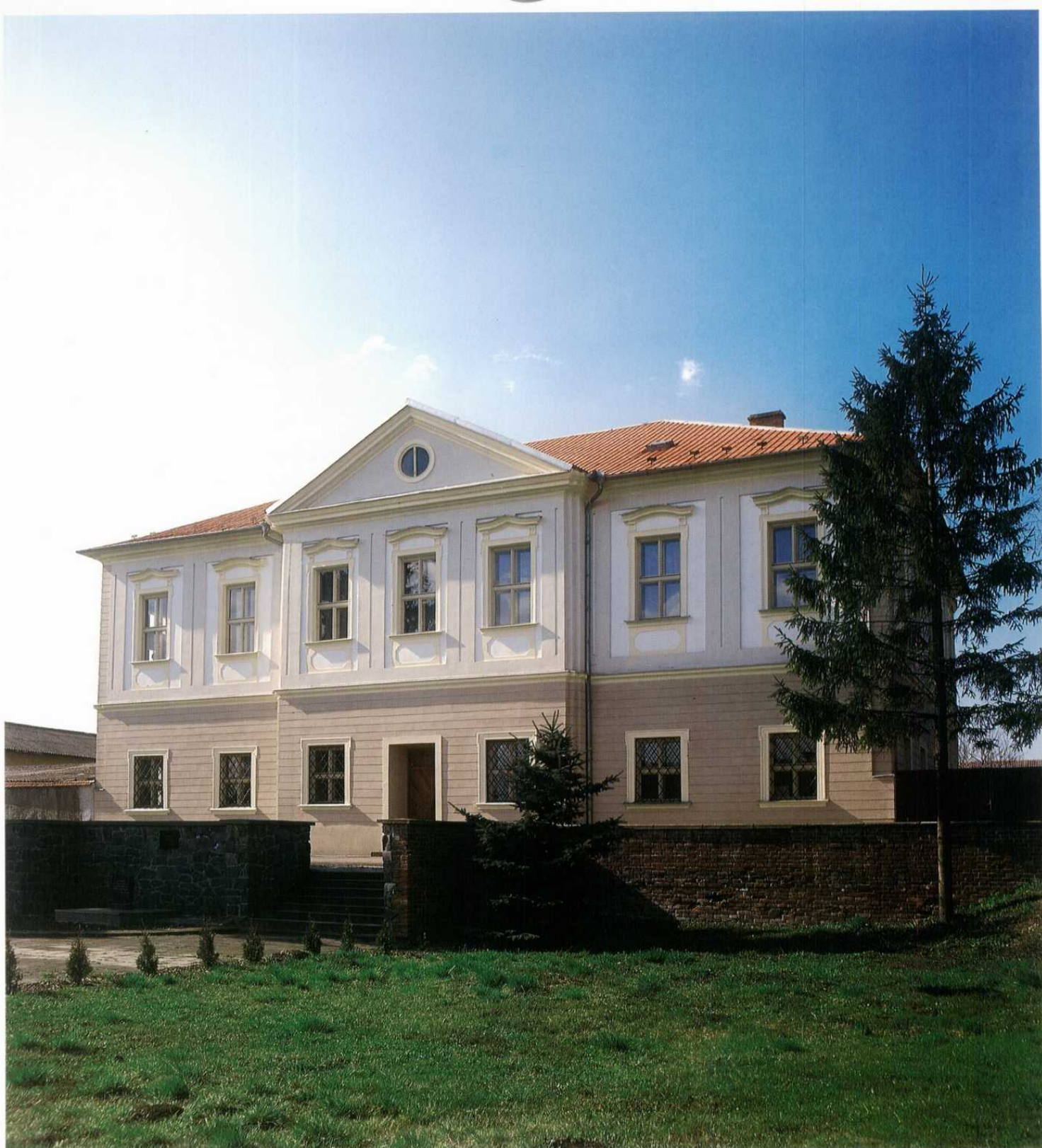
POLKOVICE - zámek, ukázka panského sídla z II. pol. 18. stol.