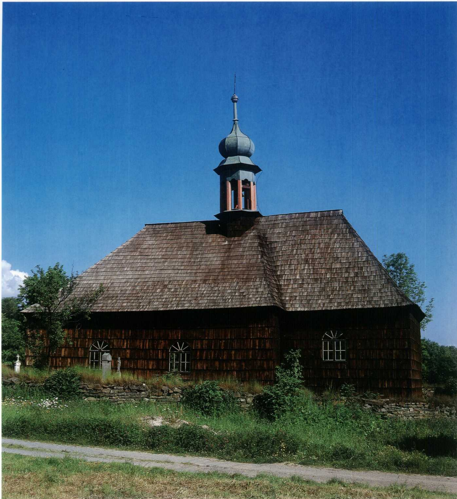
LIPNÁ - filiální kostel sv. Jana Křtitele, dřevěná lidová barokní stavba z počátku 18.století