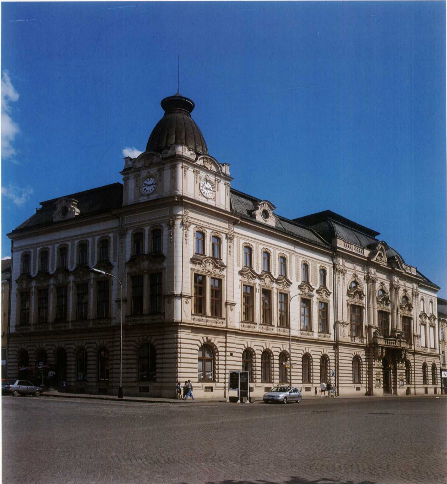
PŘEROV - budova Městského domu z r. 1897