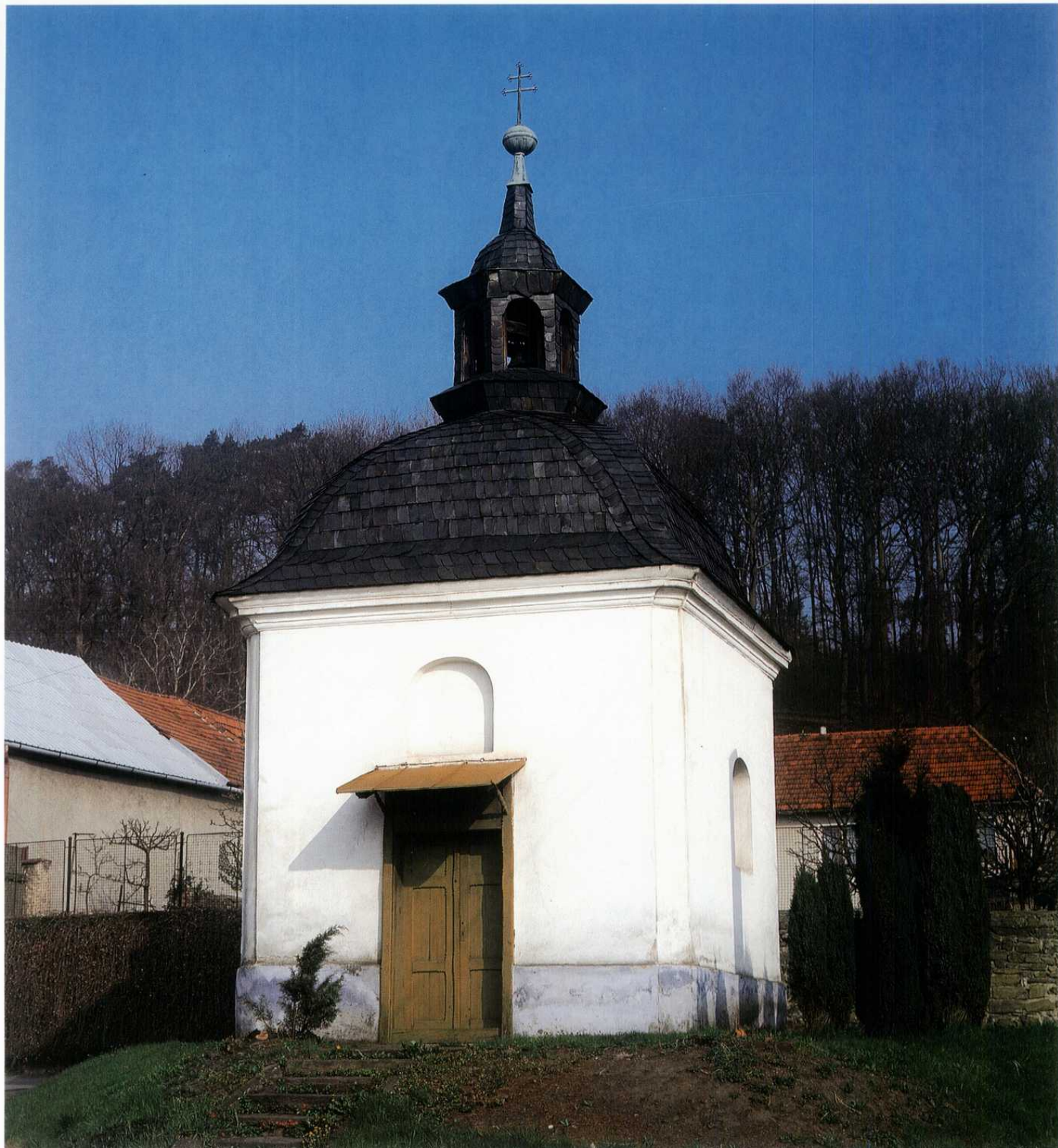
BUK - kaple sv. Urbana, barokní stavba z I. pol. 18. století