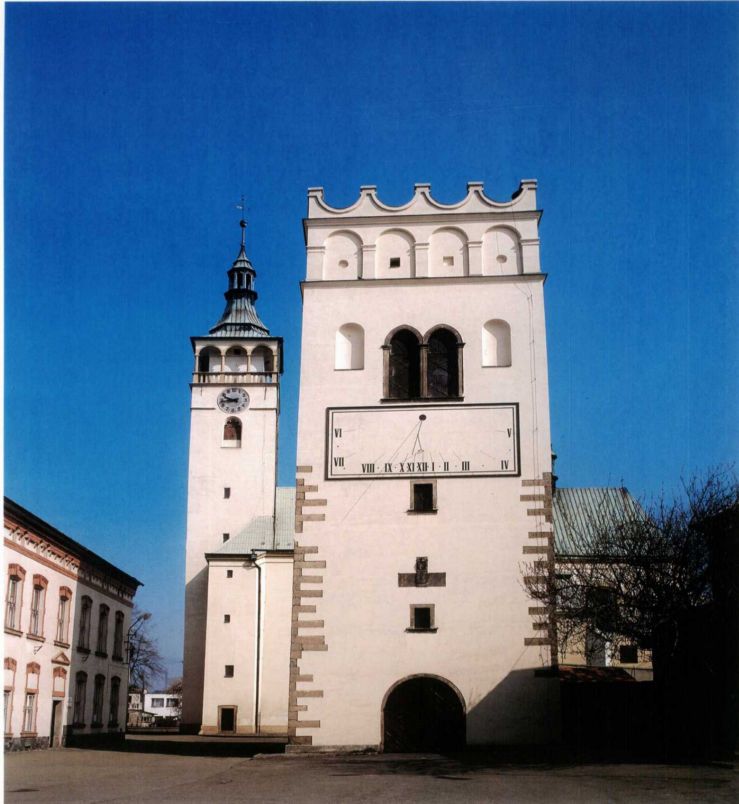
LIPNÍK NAD BEČVOU - renesanční zvonice z r. 1609