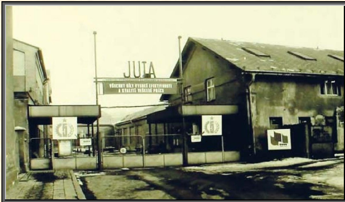
Vstupní brána ze Škodovy ulice do závodu Juta. Snímek vznikl v 70. letech minulého století, kdy v Jutě pracovalo 300 lidí