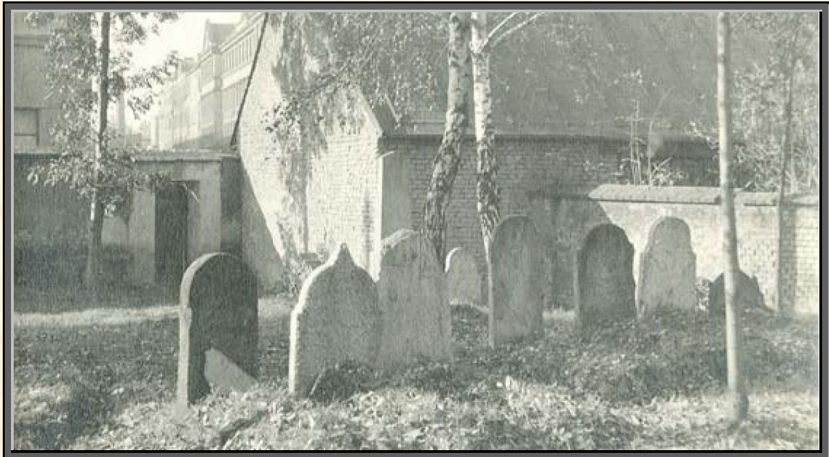
Pohled přes starý židovský hřbitov do Smetanovy ulice

Dnes je ve Wurmově ulici čilý dopravní ruch a jen málokdo si dokáže představit, že v první polovině 18. století tu stával židovský hřbitov a za zdi v době konání pohřbů zněly až do druhé poloviny 19. století rabínovy žalmy. Na místě, kde dnes stojí bytový dům zdobený kruhy, se nacházely zahrady a také poslední místo odpočinku Přerovanů s židovskými kořeny.