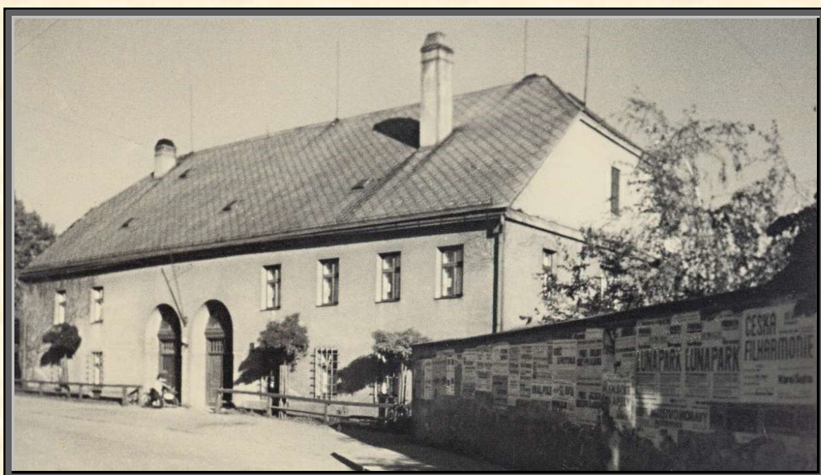
Kryškův parní mlýn na přelomu 30. a 40. let 20. století