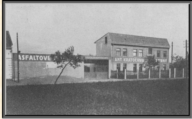
Továrna ve Dvořákově ulici