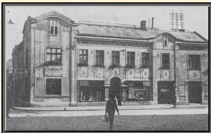
Kancelář a prodejna na Komenského třídě

Uvedená firma vyrábí dnes veškeré druhy krycích lepenek jako: dehtovou krycí lepenku pískovanou a nepískovanou, speciální dehtuprostou lepenku ochr. zn. „Bitumit“ a dvakrát impregnovanou ochr. zn.