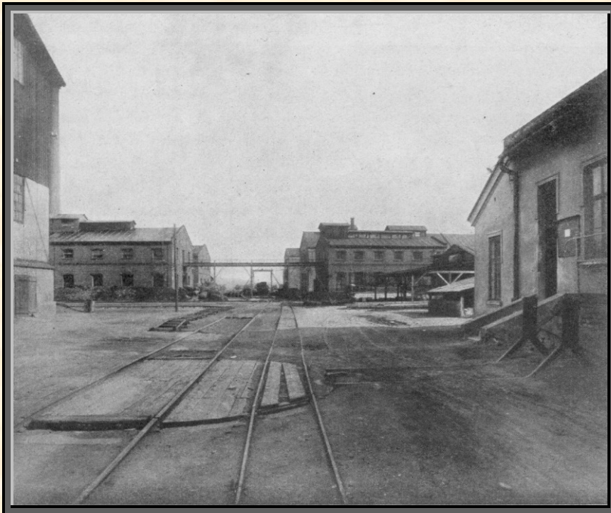
Nádvoří s vlečkou v továrně hnojiv

V roce 1917 továrna získala koupí vápenku, která s ní sousedila. Vápenka má jednu kruhovou pec a dvě pece šachtové. K vápence zakoupeny byly i vápencové lomy v Předmostí a v Sobiškách. Hlavní lom je v Předmostí „Žernova“. Výměra lomu „Žernova“ obnáší přes 100 měřic a užitečná výška dosahuje 40 až 50 metrů.