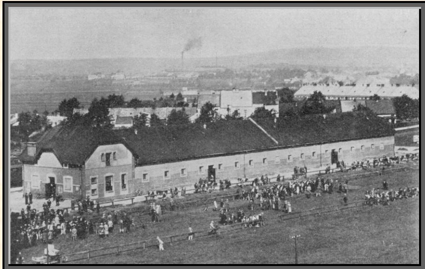
Tržnice zemědělské rady na Tratišlech

Velmi názorně působí na zemědělce společné exkurse, pořádané na zemské statky Stará Ves a Horní Moštěnice. Zde umístěny jsou ročně srovnávací pokusy ječmenů, ovsů, žit, pšenic ozimých a jarních, řep a jiných rostlin. V těchto pokusech zastoupeny jsou všechny domácí a pro nás