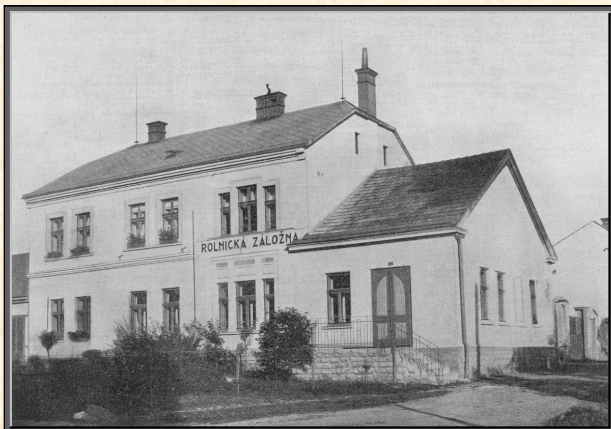
Budova Rolnické záložny